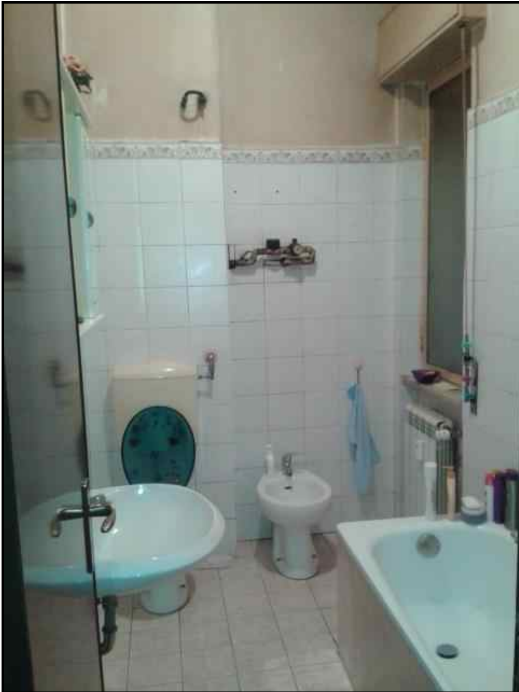
FOTO N. 13 - Bagno