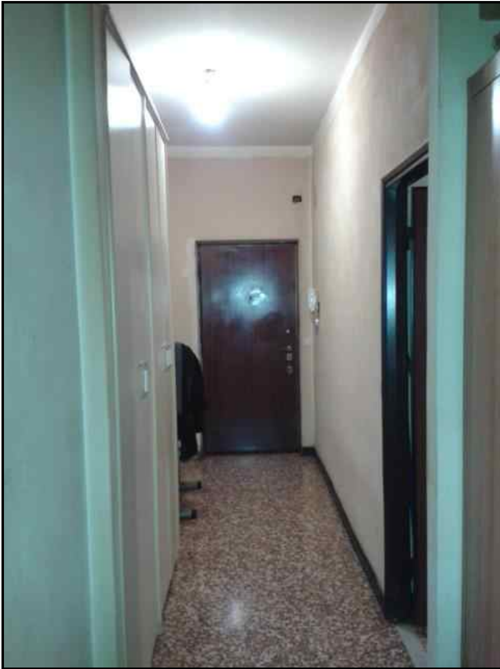
FOTO N. 9 - Ingresso