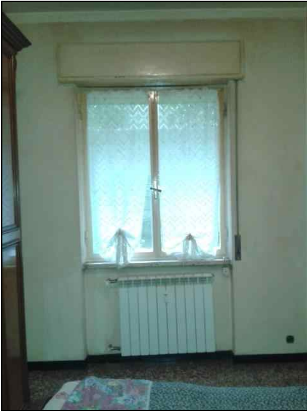
FOTO N. 12 - Camera