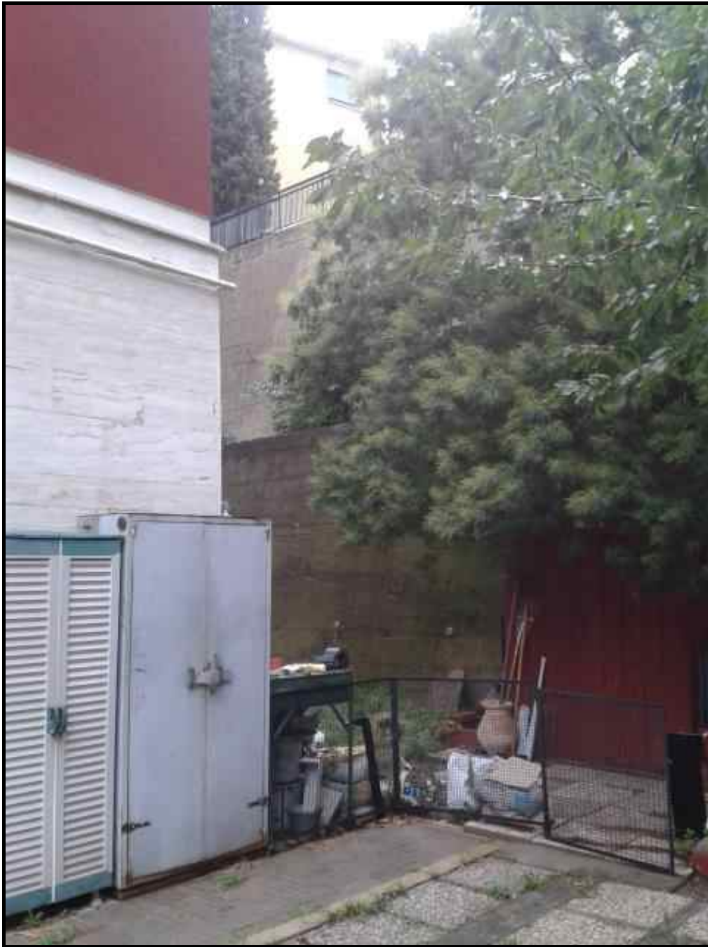
FOTO N. 7 - Giardino