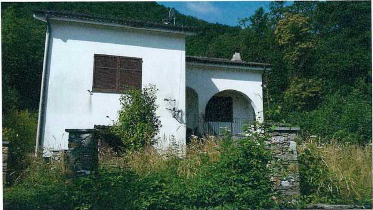
FOTO n.° 3: prospetto principale della casa, rivolto a est, verso la strada