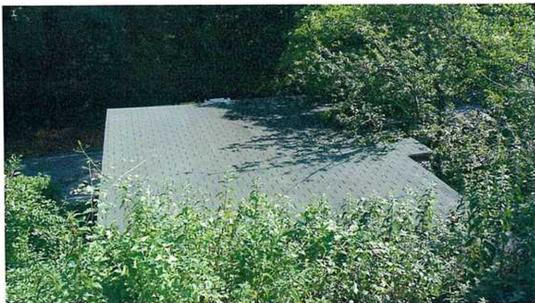
FOTO n.° 2: copertura costruzione in legno sovrastante il box, da demolire