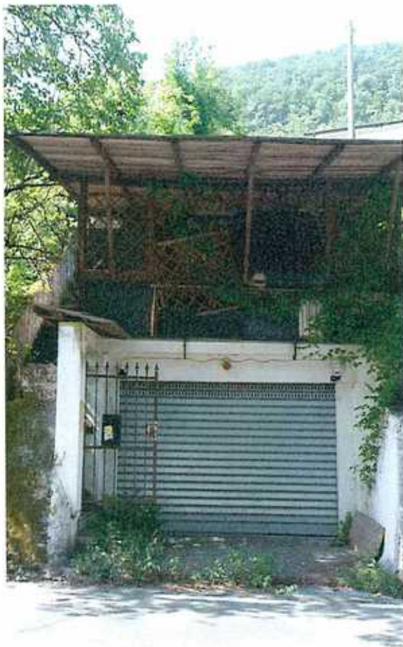
FOTO n.° 1: accesso box e costruzione in legno sovrastante, da demolire